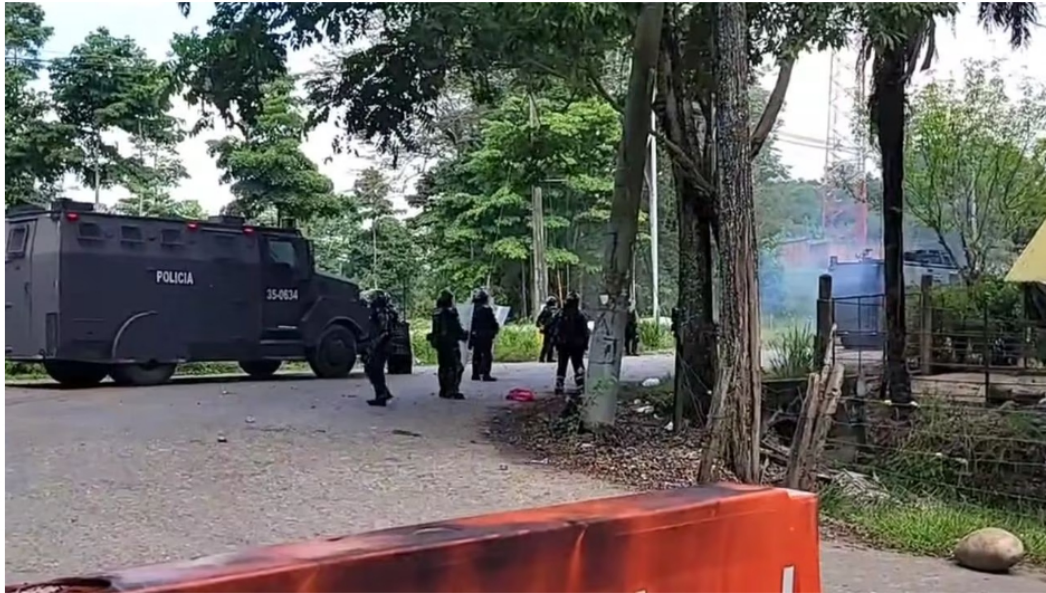
Operativo de desalojo en Yondó, Antioquia.

En disturbios y enfrentamientos entre la comunidad y las autoridades terminó un operativo de desalojo en el municipio de Yondó, en Antioquia. En medio de la alteración del orden público siete uniformados de la Policía y varios civiles resultaron heridos.