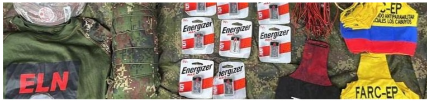
Material incautado al ELN y disidencias de las Farc en Antioquia.

“De la misma forma, se encontró material de intendencia: un uniforme camuflado de uso privativo de las Fuerzas Militares, una carpa pixelada, un buso táctico y un brazalete del ELN, 20 brazaletes del GAO-r 36 y una hamaca”, reportó el Ejército Nacional.