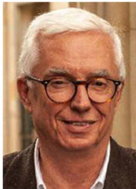
Por JORGE ENRIQUE ROBLEDO*