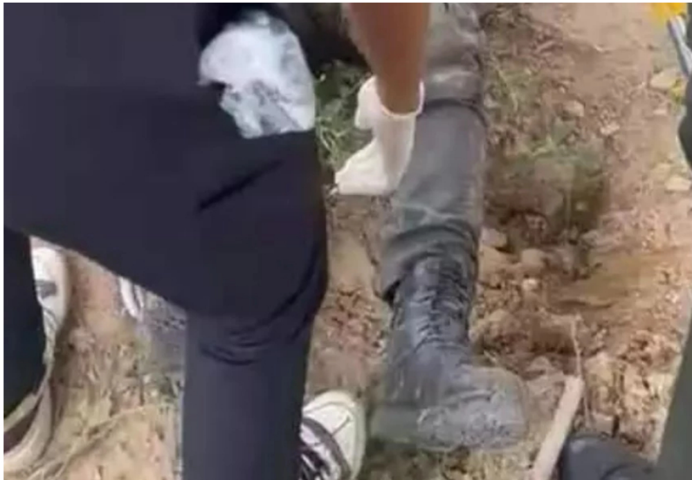
Policía herido por explosión en Yondó, Antioquia.

El hospital del Magdalena Medio entregó un reporte actualizado sobre el estado de salud de los uniformados heridos en la explosión.