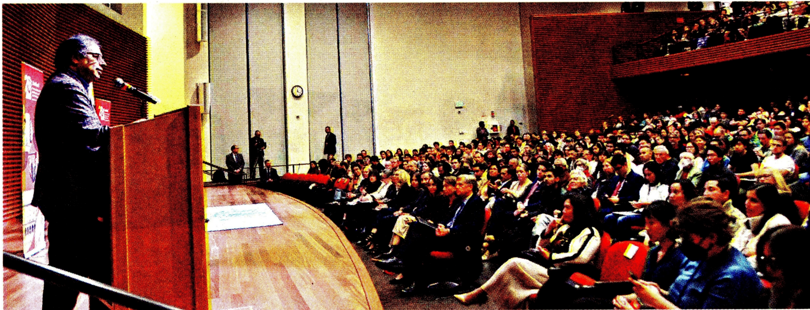
Conversatorio con el Presidente de Colombia, Gustavo Petro Urrego, en la Universidad de Stanford.