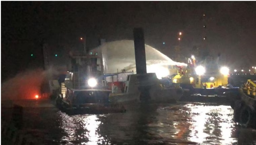
El incendio no dejó lesionados ni víctimas mortales