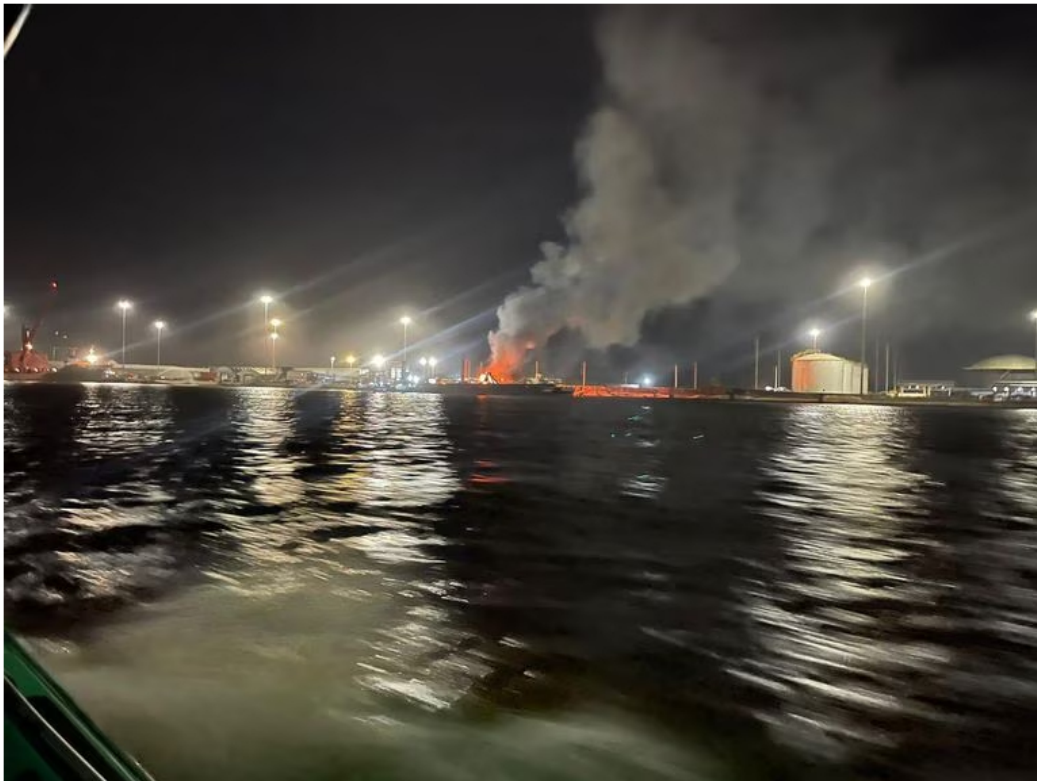
La emergencia inició en una barcaza sobre el río Magdalena