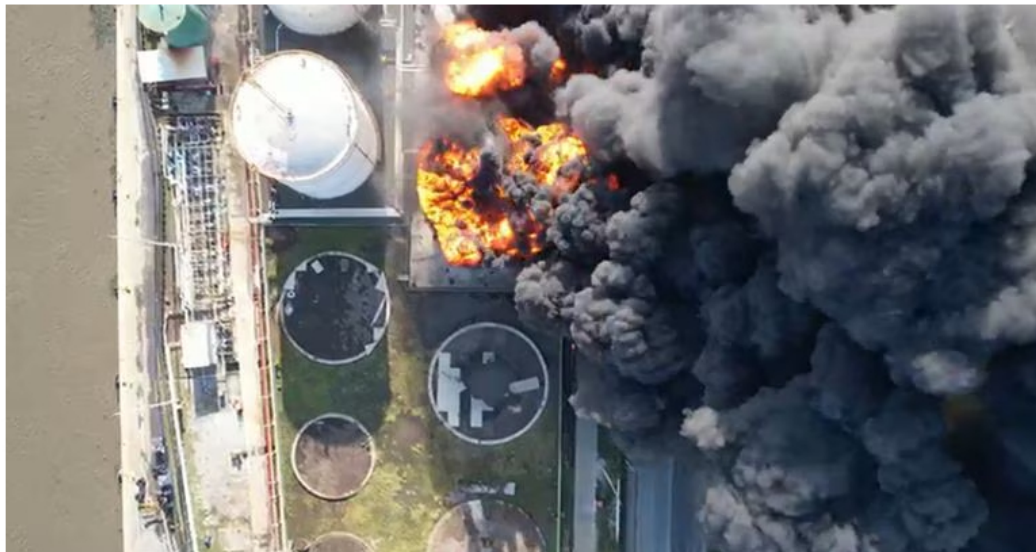
Incendio en el Puerto de Barranquilla.