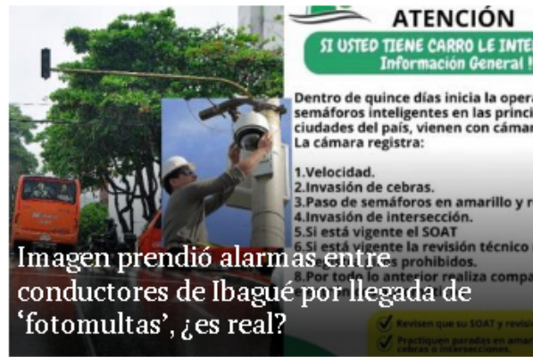
Imagen prendió alarmas entre conductores de Ibagué por llegada de 'fotomultas', ¿es real?

¿Clara Chía era hombre? Supuestas pruebas señalan que Piqué pagó por su reconstrucción