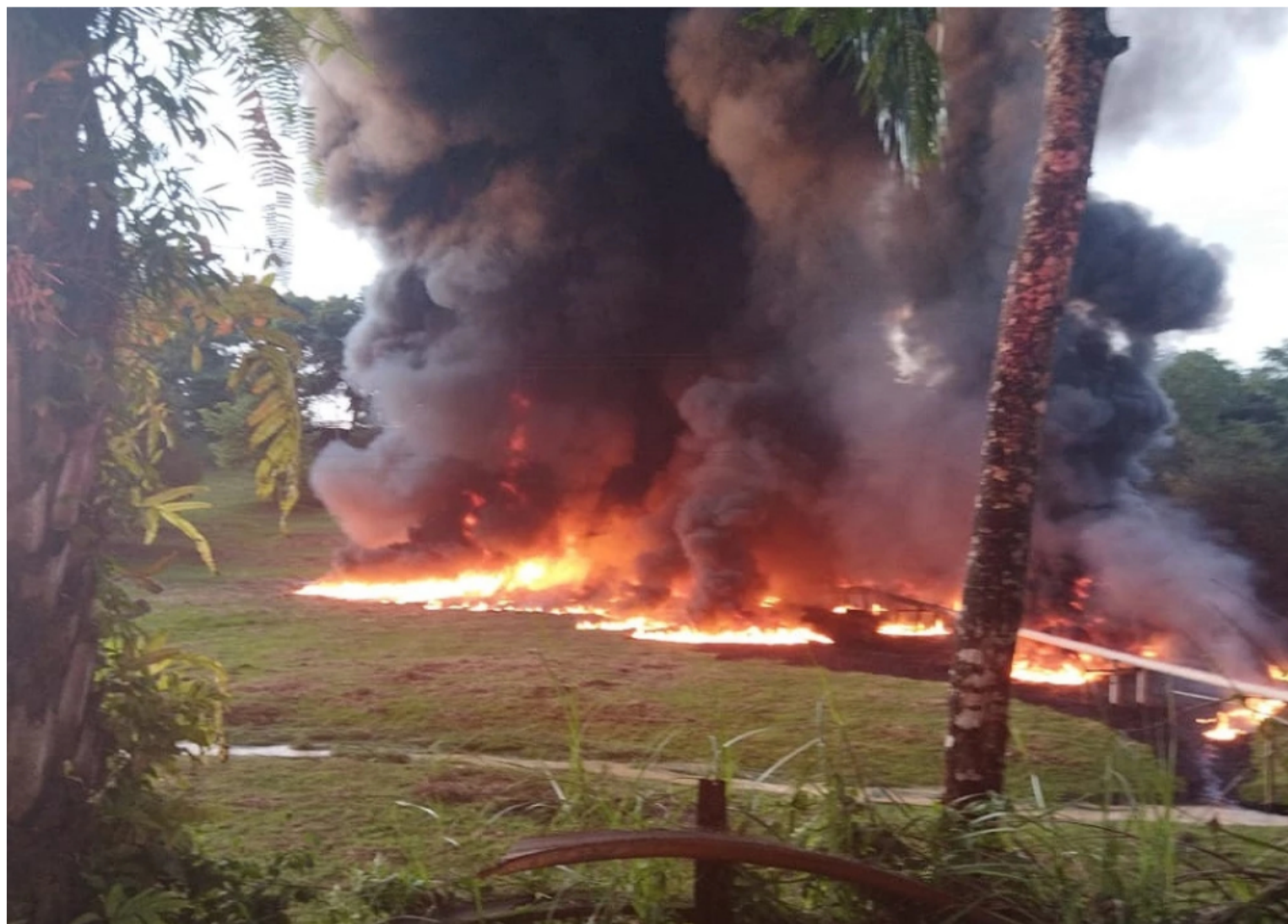
BLU Radio. incendio atentado en Barrancabermeja

Miembros del Ejército aseguraron el área para el ingreso del personal técnico que atenderá este atentado al oleoducto Caño Limón – Coveñas, que estaría relacionado con el accionar de grupos armados ilegales.