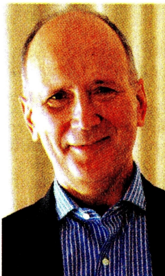
Juan Emilio Posada, presidente de ISA.

Hay varios proyectos para fortalecer la confiabilidad y la transición energética en Colombia, pero el principal y el que esperamos que salga es el proyecto de Corriente Directa de Alto Voltaje que se constituirá para sacar la energía renovable de La Guajira hacia el centro y sur del país. Es de aproximadamente 1.800 millones de dólares y con toda seguridad vamos a hacer protagonistas muy activos. Además, hay más de seis paquetes de licitaciones grandes en Brasil que salen en junio y estamos seleccionando en cuáles vamos a participar y en cuáles no. En total, esperamos ganarnos pro-