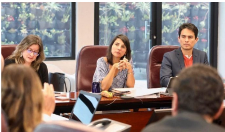
Irene Vélez, ministra de Minas, habla de Ricardo Roa, nuevo presidente de Ecopetrol.

Este martes 12 de abril, en horas de la noche, la Junta Directiva de Ecopetrol decidió elegir a Ricardo Roa como el nuevo presidente de la firma pública más importante de Colombia. Sobre la llegada de Roa, la ministra de Minas y Energía, Irene Vélez, se refirió al tema.