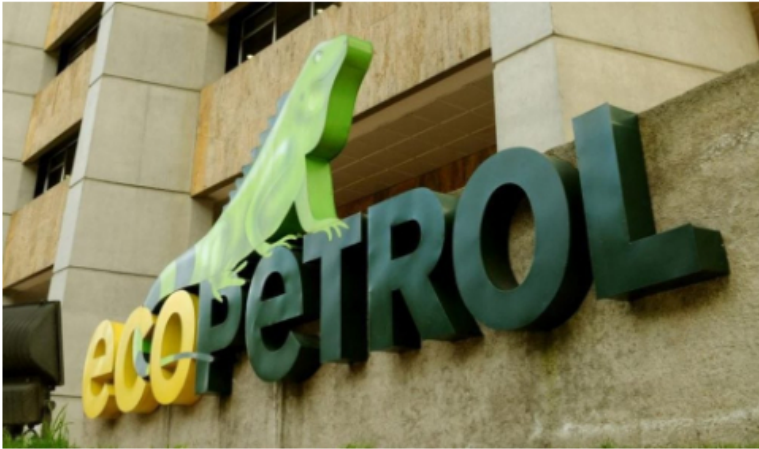
Edificio de Ecopetrol en Bogotá.

tiempo que se garantiza la seguridad energética del país.