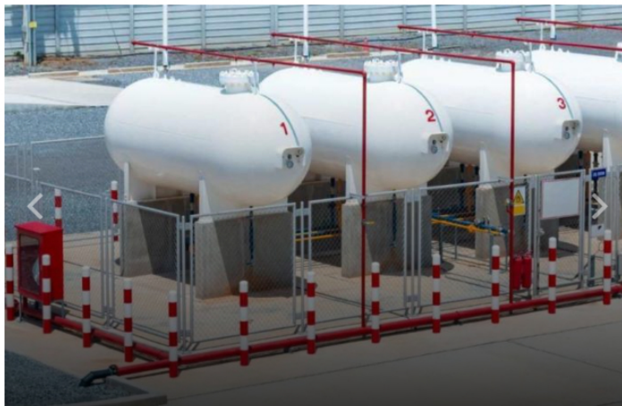
Propuestas de Gasnova para impulsar el gas GLP.

TRENDS Letha Trend 10 minutos ago REPORT