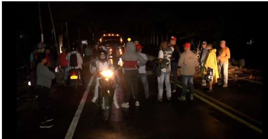
Este bloqueo se presenta desde la madrugada del lunes, 10 de abril.

Por su parte, Ecopetrol señaló que “ la empresa lidera un programa de diversidad orientado a contribuir al desarrollo de la equidad, la igualdad y el derecho al trabajo y en el que promueve la inclusión a poblaciones de difícil inserción laboral”.