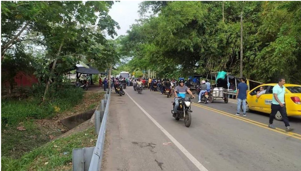
Los bloqueos se han vuelto constantes en esta zona.

Más de 48 horas completan las manifestaciones y bloqueos en el puente Guillermo Gaviria que comunica a Barrancabermeja (Santander) con Yondó (Antioquia). La situación ha afectado las operaciones de producción de Ecopetrol , a tal punto que varios contratos han tenido que ser suspendidos.