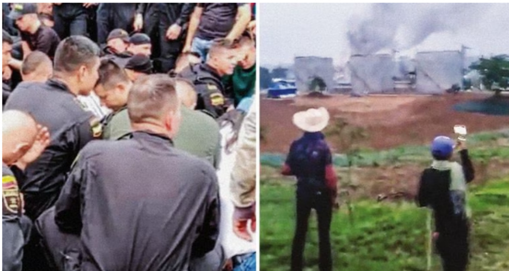
Más de 800 campesinos e indígenas superaron al escuadrón del Esmad que estaba custodiando un campo petrolero en San Vicente del Caguán, Caquetá. Los pobladores les quitaron los uniformes, el armamento y los secuestraron.

Tres: que ya secuestrados rogaban para que les enviaran un apoyo que, pues por orden del alto Gobierno, tanto del presidente como de su ministro de Defensa, nunca iba a llegar. Y como una mentira, mientras ocurrían los hechos, les pedían “paciencia, paciencia, que ya les mandamos ayuda”. Cuatro: que a raíz de este cuadro, tanto la Procuraduría como la Fiscalía, abrieron investigaciones contra altos mandos militares por la omisión gravísima de no enviar apoyos a los policías.