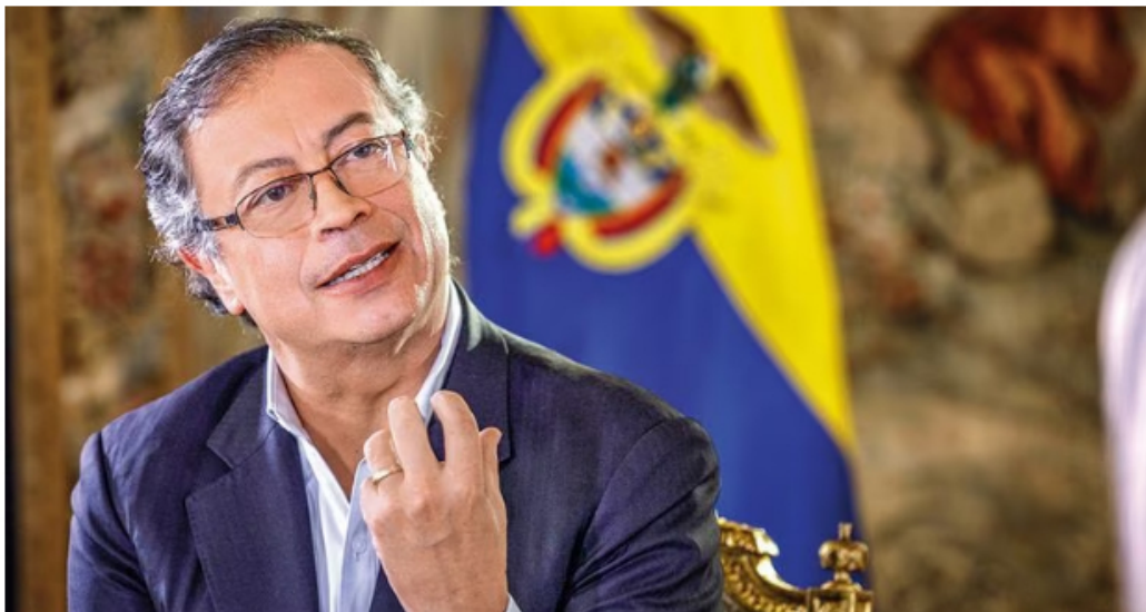
El presidente Gustavo Petro dice que se necesita otro gobierno para cumplir el punto uno de los acuerdos de paz.

Obviamente el expresidente Duque le reviró a su sucesor, reclamándole, por lo que generalmente se le reclama a Petro: que está mintiendo con las cifras. Algo en lo que el actual presidente incurre con frecuencia y con gran facilidad. Que bajo su gobierno, por el contrario, ingresaron 1,7 millones de hectáreas al Fondo de Tierras en más de 14.000 predios. Y que confundir predios con hectáreas es una falta de rigor intencional.