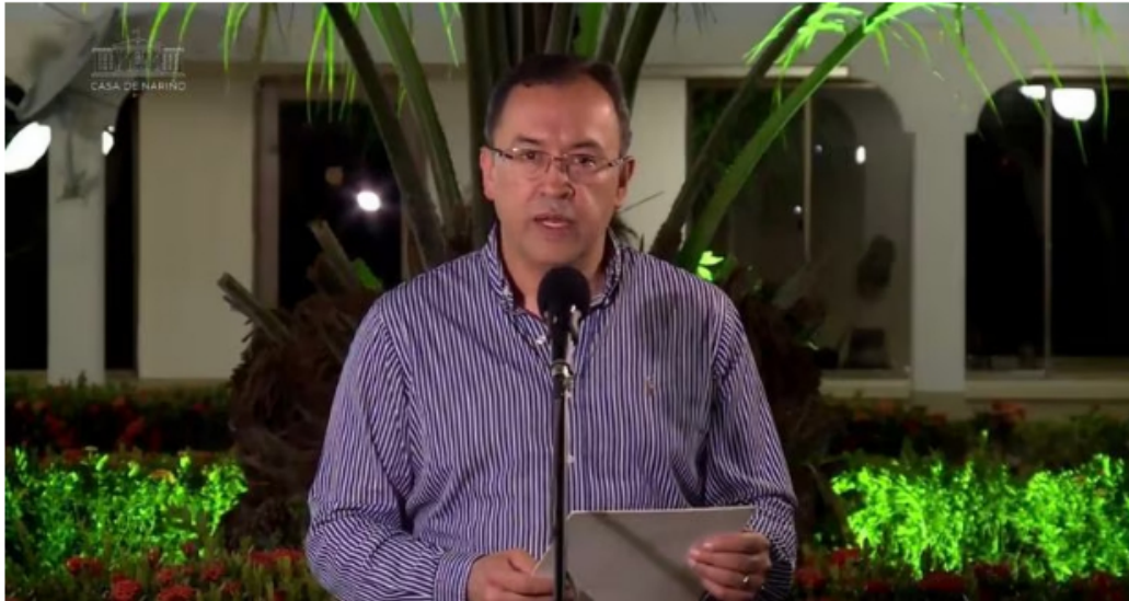
Ministro del Interior Alfonso Prada

misión de apoyar a un puñado de soldados, estos sí armados, que custodiaban las instalaciones de una petrolera en la zona. Dos: que los policías fueron secuestrados en lo que el ministro del Interior, Alfonso Prada, bautizó insólitamente como “cerco humanitario”, en medio del cual los miembros del Esmad fueron maltratados.