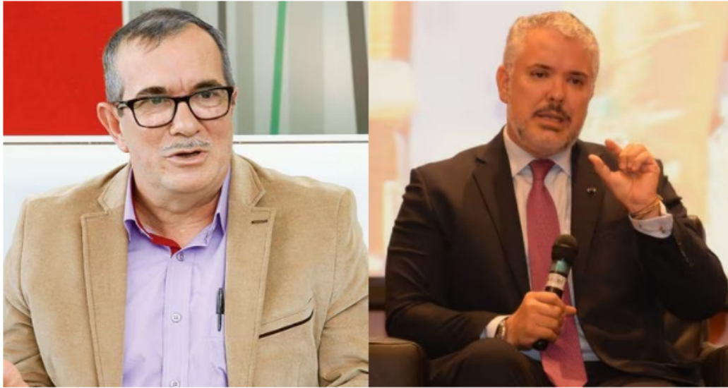
De izquierda a derecha: Rodrigo Londoño, ex líder de la Farc, y el expresidente Iván Duque. Tras la firma de los acuerdos en 2016, no se ha podido cumplir con la indemnización a víctimas, Petro culpa a Duque.

ensanchar su toma de las ciudades; sino también empantanado con los narcos, que no han cumplido ningún cese al fuego y se siguen matando entre ellos mismos.