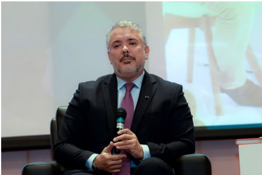
Petro le echó la culpa a Duque por no poder responder ante las víctimas de las Farc.

Pero a eso súmenle la queja de las ex-Farc, hoy partido Comunes, de que no les han cumplido con el acuerdo que firmaron en La Habana, y reafirmaron en el Teatro Colón. Y, ¿qué dice el presidente? Que es que el Gobierno no tiene 150 billones que necesita para indemnizar a las víctimas, y que en el Gobierno Duque hicieron trizas el acuerdo.