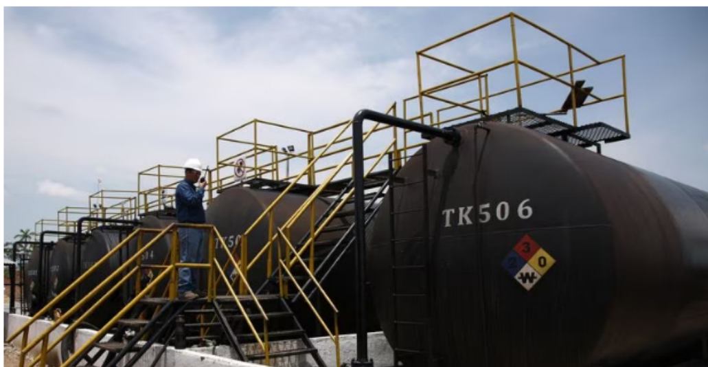
Planta de producción de petróleo Emerald Energy Plc hidrocarburos en el campo Capella en la inspección de Los Pozos en San Vicente del Caguán.

El Gobierno explicó que gracias a ello se salvaron vidas, a cambio, claro, de que los sediciosos —tras los cuales, eso sí dicen las autoridades, se escudaban fuerzas del narcotráfico— hubieran ocupado a la fuerza un territorio espantando a una empresa petrolera que ya no va a cumplir por fuerza mayor sus compromisos con el Estado.