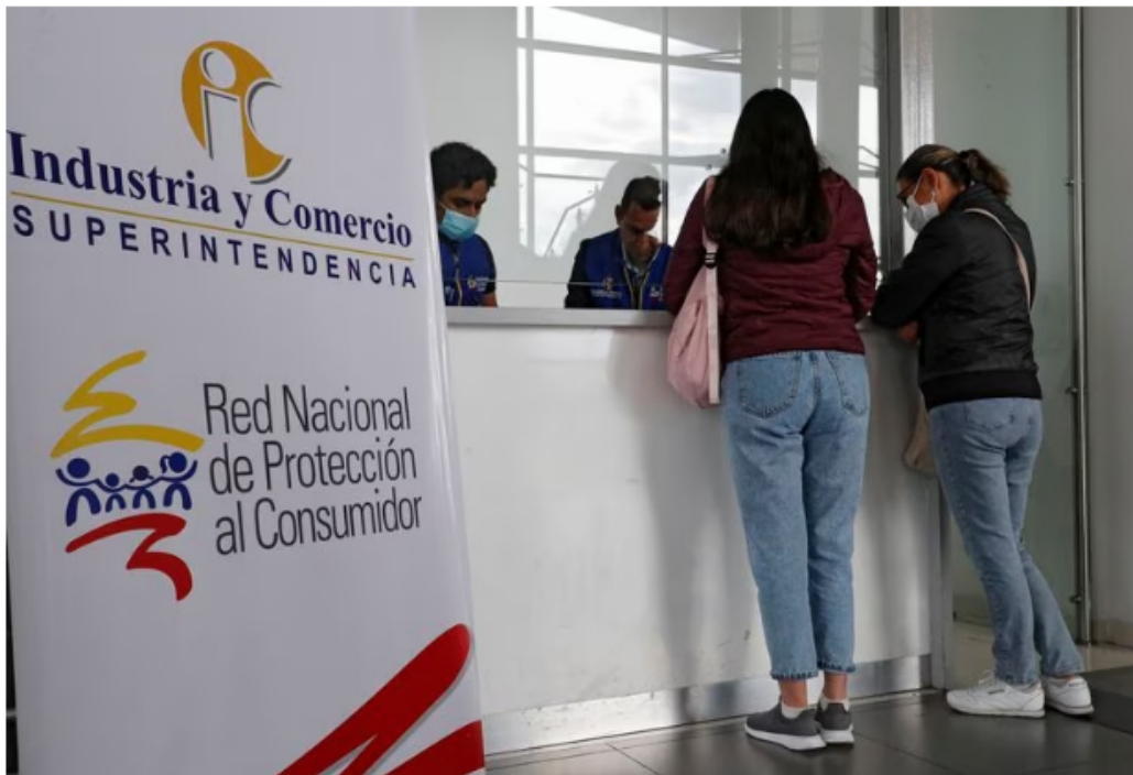
Ante la suspensión de las operaciones por parte de la aerolínea Viva Air, la Superintendencia de Industria y Comercio SIC habilitó una ventanilla para que los pasajeros demanden por "presunta vulneración de sus derechos como consumidor"

Marcas. En total, tiene más de 31 años de experiencia en el sector público.