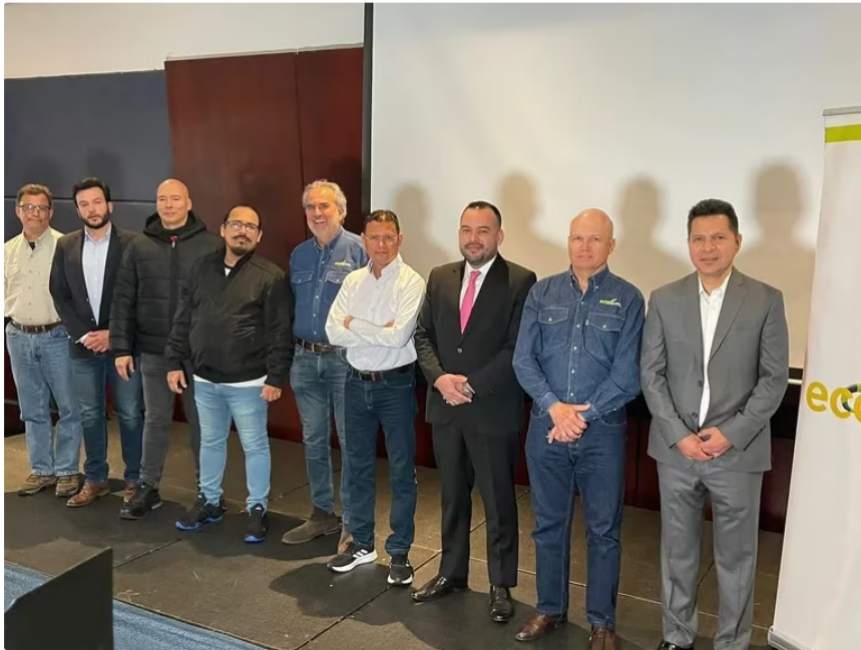
Primera reunión de negociación de Ecopetrol

La Junta Directiva de Ecopetrol inició la negociación con tres sindicatos de la compañía, uno de ellos la USO , que presentó 101 peticiones con las que, aseguran, buscan convenir condiciones justas para los y las trabajadoras de la industria del petróleo. A raíz de la firma del acta de garantías han surgido versiones que indican que el costo de atender los reclamos ascendería a billones de pesos y pondrían en riesgo las finanzas de la petrolera.