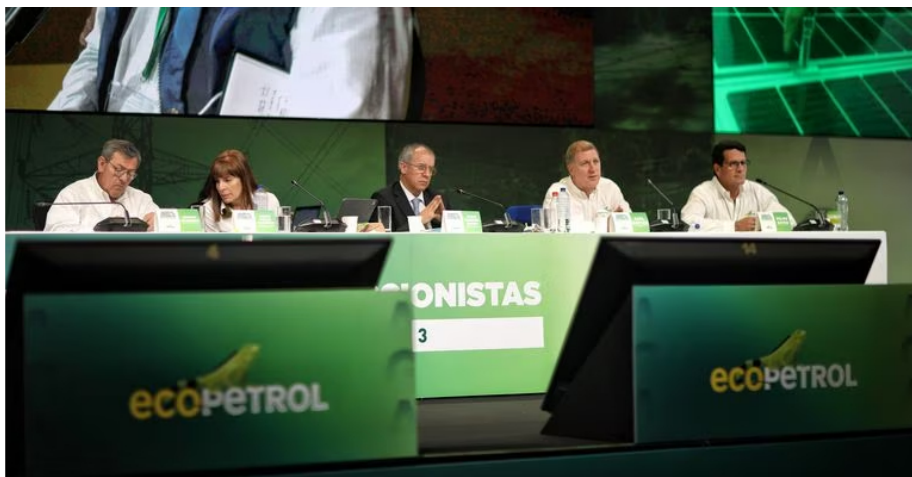
Imágenes de la asamblea ordinaria de accionistas de Ecopetrol, realizada el 30 de marzo.

El ingeniero mecánico, de 62 años, formado en la Universidad Nacional, había sonado para el Ministerio de Minas, pero algo pasó y ese sonajero se silenció.