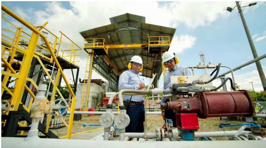
Transición energética, algo que ya Ecopetrol ha venido haciendo.

El mayor reto para Roa será sin duda mantener la pujanza que ha tenido Ecopetrol , ayudada por el precio del petróleo y el del dólar, pero ahora, inmersa en un proceso de transición energética, justamente, para ir dejando atrás los hidrocarburos. En 2022, las utilidades de la petrolera fueron de 33,4 billones de pesos, es decir, el doble del resultado obtenido en 2021, que fue de 16,7 billones. El desafío para el nuevo presidente es grande.