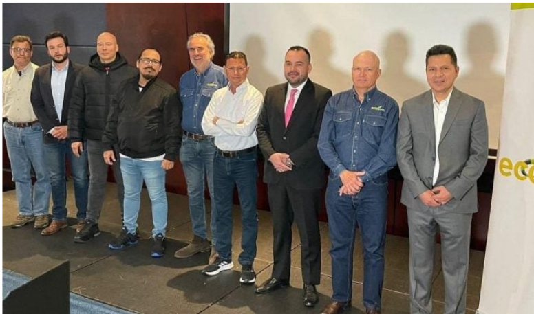
Peticiones de la USO a Ecopetrol .

Por Yennyfer Sandoval - Periodista Minería y Energía · 2023-04-10