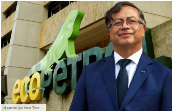
el cambio que busca Petro - .

LOCAL Stacy Local about 6 hours ago REPORT