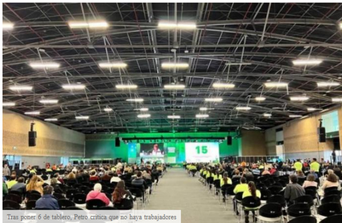
Tras poner 6 de tablero, Petro critica que no haya trabajadores

Presidente gustavo petro criticó en su cuenta de Twitter que no hay representantes de los trabajadores en la junta directiva de Ecopetrol , a pesar de que ella misma ha elegido a seis de los nueve integrantes y no los ha tomado en cuenta.