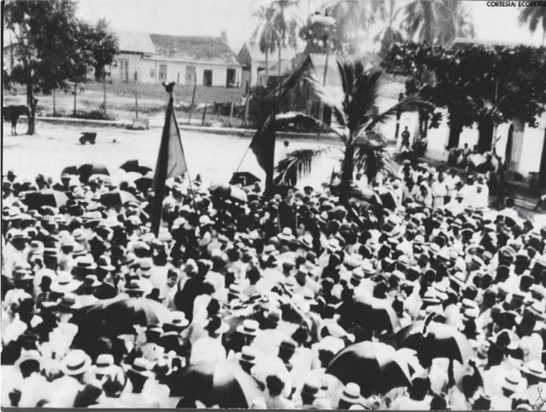
Unión Sindical Obrera (USO)

“Este hecho sentó las bases de la reversión de la Concesión de Mares y la creación de Ecopetrol como la primera empresa petrolera estatal colombiana, la cual empezó a operar el 25 de agosto de 1951”, señaló en un artículo que tituló “Lo que se dice de la creación de Ecopetrol ”.