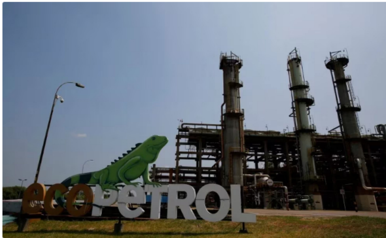
Foto de archivo. Panorámica de la entrada a la Refinería de Ecopetrol en Barrancabermeja, Colombia, 1 de marzo, 2017.