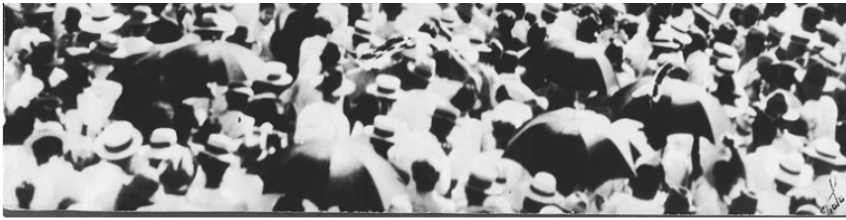
Unión Sindical Obrera (USO)