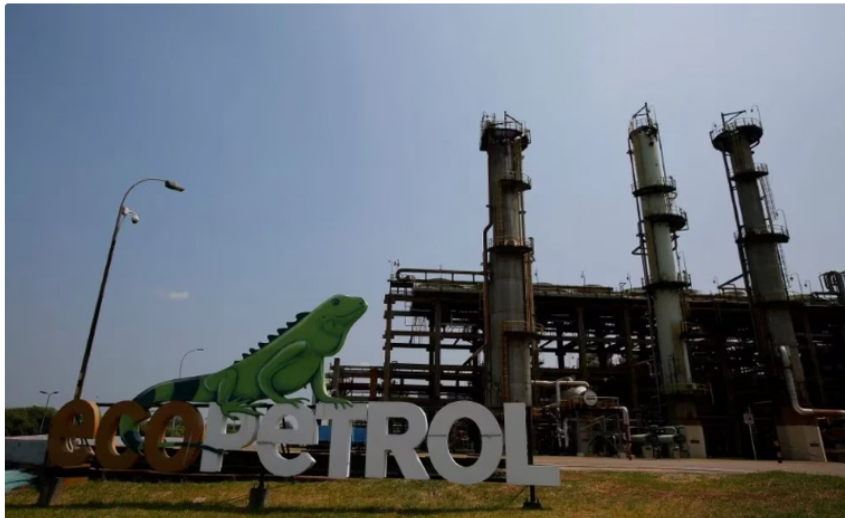
Foto de archivo. Panorámica de la entrada a la Refinería de Ecopetrol en Barrancabermeja, Colombia, 1 de marzo, 2017.