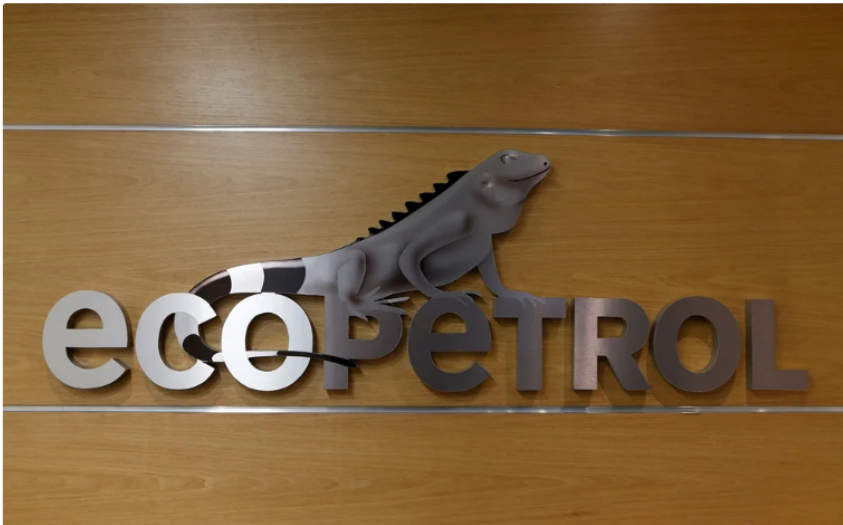
FILE PHOTO: The logo of Ecopetrol is pictured at its headquarters in Bogota, Colombia August 11, 2017. Picture taken August 11, 2017.

El presidente Gustavo Petro volvió a hablar de Ecopetrol y, por supuesto, generó todo tipo de comentarios. Esta vez se refirió sobre la conformación de la junta directiva de esta compañía, que sería empresa clave para la transición energética del país. El mandatario aseguró por medio de Twitter que en esta debería haber un representante de los trabajadores.