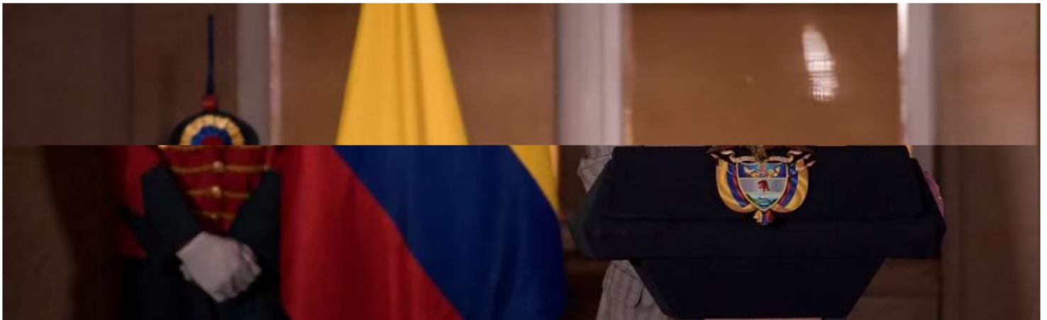
Ceremonia de presentación de la Reforma Laboral, por parte de la ministra de Trabajo y el presidente Gustavo Petro.