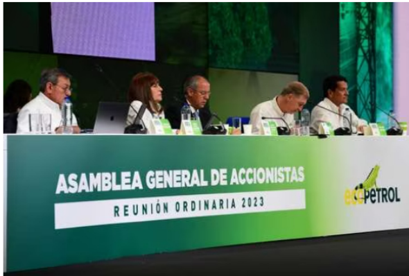
En las decisiones de la empresa tiene que primar un mensaje de autonomía y respeto por el gobierno corporativo.