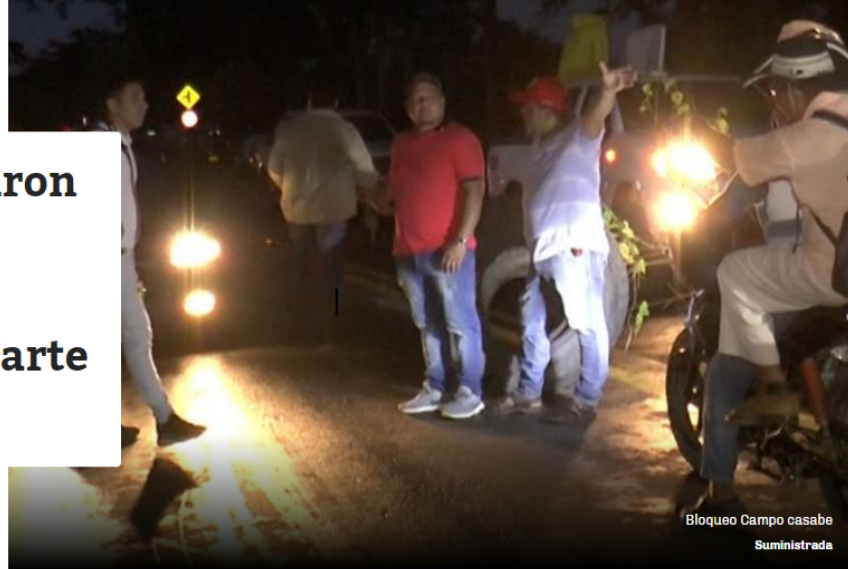
Bloqueo Campo casabe