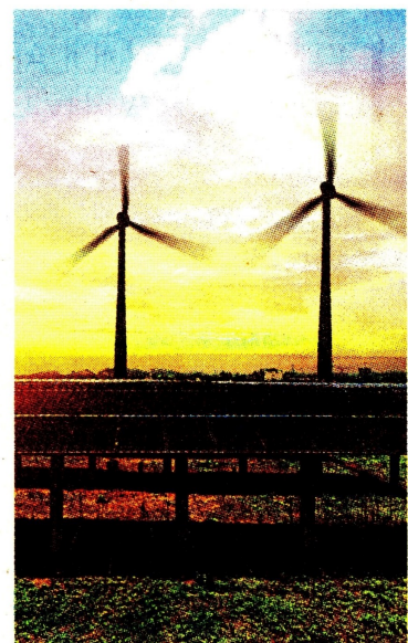
Se habían destinado $6.570 millones para 10 proyectos.

De esta forma los proyectos que ya tienen conexión a la red podrían participar en el proceso competitivo lanzado por la Creg, para suplir las necesidades del mercado. ☞