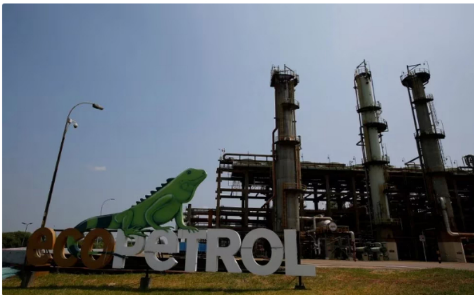
Foto de archivo. Panorámica de la entrada a la Refinería de Ecopetrol en Barrancabermeja, Colombia, 1 de marzo, 2017. REUTERS/Jaime Saldarriaga

Ecopetrol , a través de un comunicado, dio cuenta y denunció un nuevo atentado en contra de una de sus infraestructuras ubicada en La Cira Infantas, en Barrancabermeja . El hecho se habría presentado en horas de la madrugada del viernes 31 de marzo de 2023 .