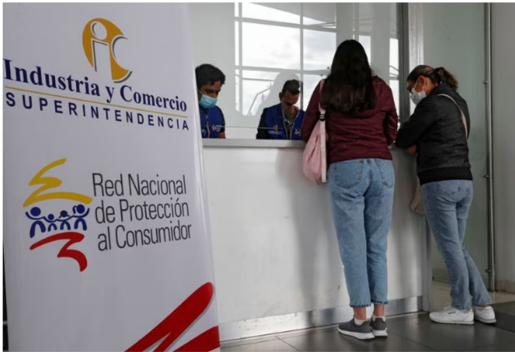
Ante la suspensión de las operaciones por parte de la aerolínea Viva Air, la Superintendencia de Industria y Comercio SIC habilitó una ventanilla para que los pasajeros demanden por "presunta vulneración de sus derechos como consumidor"