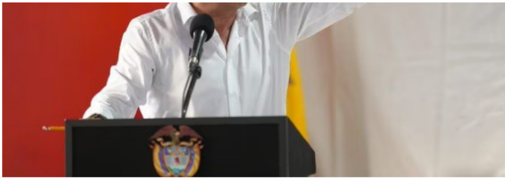
Presidente Gustavo Petro

Por lo pronto, una toma de una empresa con propósitos incautatorios de celulares y computadores, por fuera del alcance de los funcionarios que los operan, casi que sólo se ve en las películas. O si acaso en el divertido reality MasterChef cuando la orden es: “Se acabó el tiempo, manos fuera de las estufas”.