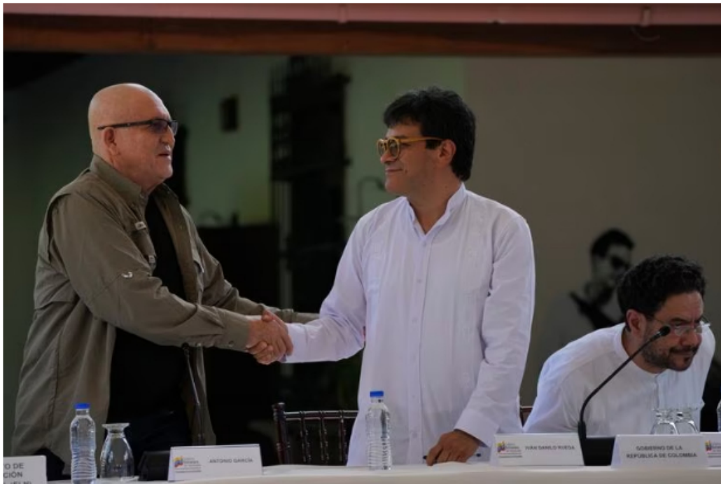
De izquierda a derecha: Antonio García, jefe del ELN, e Iván Danilo Rueda, alto comisionado para la Paz.

Faltaba más que no, pues, que ahora los culpables de que García y sus compinches se sientan con el derecho, y lo declaren, de masacrar soldados por cuenta de que no han firmado un cese al fuego con el Gobierno sea de los medios. No, señor García, los medios de comunicación transmiten sus crueles acciones, pero no ocultan su asombro ante su doble mensaje. Hoy sentados en conversaciones con el Gobierno mientras miran a ver de qué lado le disparan al Estado.