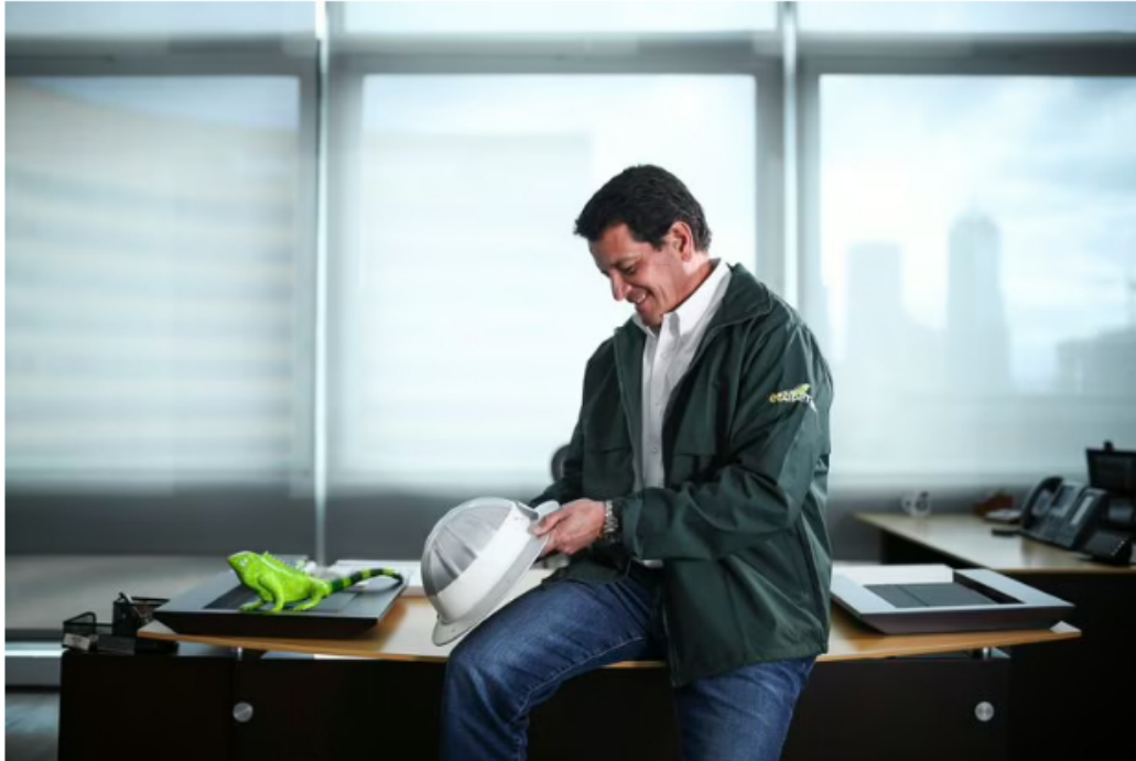
FELIPE BAYÓN ECOPETROL 01 DE MARZO 2023

lado de la contratación de servicios de helicópteros se investigan direccionamientos en contratos de abastecimiento, cartelización de carros blindados, abusos de posesión de dominio y operaciones de integración en las que han mediado sesiones de derechos contractuales.