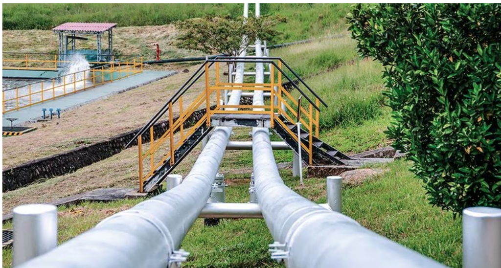
Se averiguan posibles actos de corrupción en la contratación de insumos en la Orinoquia.

En otro caso, la firma Odin Petroil presentó una queja formal por las cesiones de contratos y derechos de exploración en unos negocios conjuntos, que representarían un abuso de la posición de dominio de Ecopetrol . Al parecer, hubo un cambio de participaciones accionarias en cesiones de contratos y Ecopetrol no habría dejado participar a la compañía. Además, se empezó a detectar que Ecopetrol no estaba informando de operaciones de integración sobre esos negocios, es decir que no pasaban por la SIC. Barreto explicó que, cuando se “empieza a exceder un porcentaje en el mercado y, además, se tiene una posición de dominio, lo más ortodoxo es notificar a la SIC”.