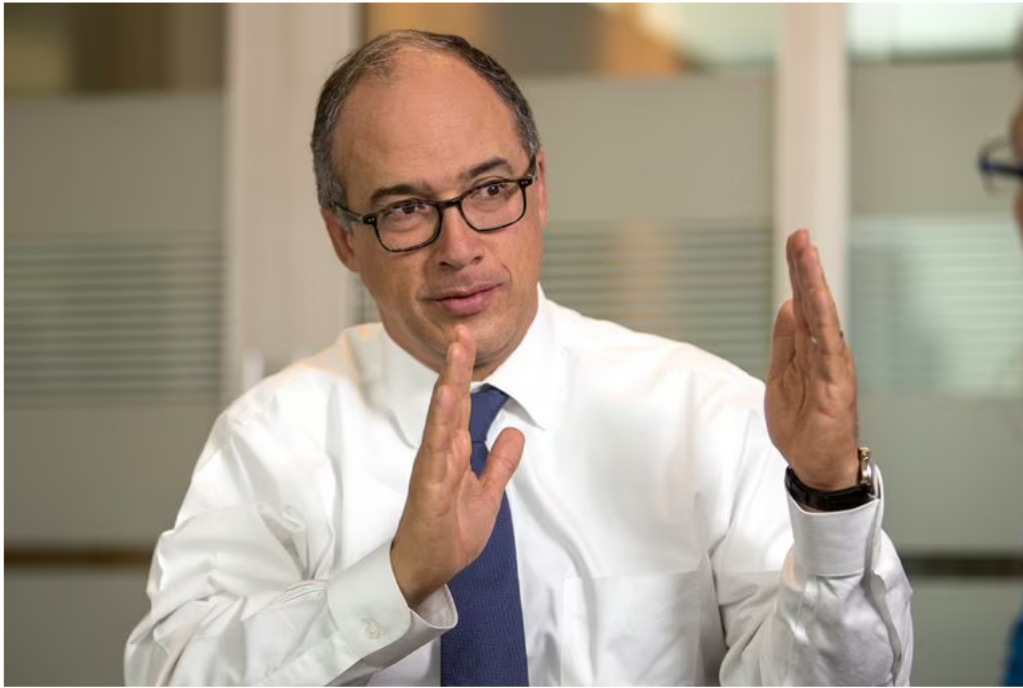
Juan Carlos Echeverry, exministro de Hacienda y expresidente de Ecopetrol .

“Hay que tener mucho cuidado con este tipo de anuncios por el daño que pueden causar en una empresa de semejante tamaño y tan preponderante para la economía. La prudencia es necesaria cuando se habla de una empresa que está listada en bolsa”, dijo, y aunque tiene claro que, pese al anuncio de la SIC, la acción de Ecopetrol no ha bajado de precio, al contrario, aumentó –al cierre del viernes creció 1,82 por ciento–, afirmó que tal vez podría haber subido más si no fuera por este tipo de noticias.