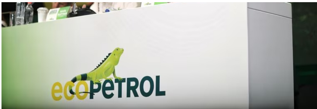
Asamblea de accionistas de Ecopetrol.