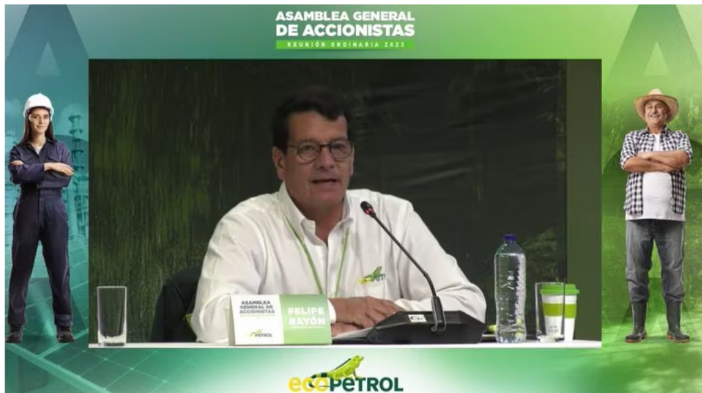
El presidente de Ecopetrol , Felipe Bayón, durante la asamblea de accionistas de la petrolera, la última a la que asistirá debido a su retiro del cargo.

A su vez, Ecopetrol también se pronunció y manifestó su colaboración con la Superintendencia en las gestiones que realiza para proteger la libre competencia. Sin embargo, la atención estaba puesta en Felipe Bayón y en su reacción a esta situación. Su mensaje fue muy corto, pero contundente: “ Ecopetrol ha actuado de cara al país”.