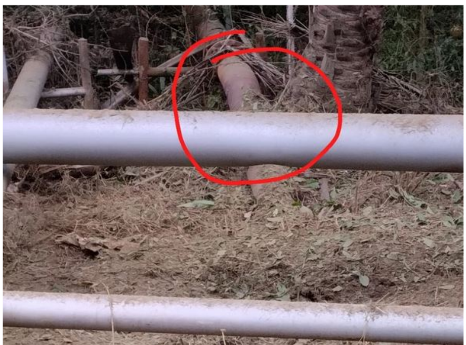
Atentado a oleoducto de Ecopetrol en Barrancabermeja

Policía y Ejército inspeccionan la zona en el corregimiento El Centro donde ocurrió el atentado que habría sido perpetrado por la guerrilla del ELN.