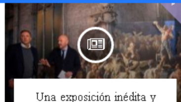
Una exposición inédita y gratuita de Sorolla llega a Valencia

(Lea también: Tras crisis de Ultra Air, Gobierno analiza reducir IVA en pasajes aéreos)