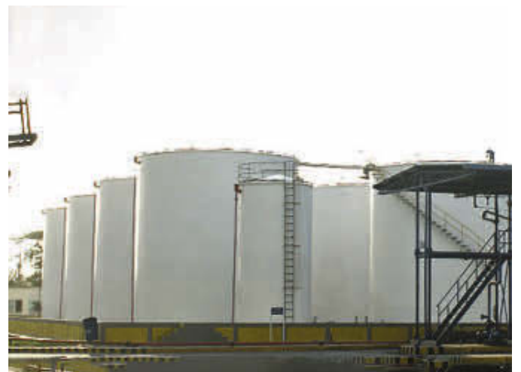
Una de las investigaciones de la SIC está relacionada con una denuncia de abuso de posición dominante interpuesta por Odín Petroil.

De esta manera, uno de los cuestionamientos es que dicho contrato se adjudicó bajo la modalidad de contratación directa, que permite a las entidades públicas celebrar contratos sin necesidad de llevar a cabo una convocatoria pública. Pero una de las