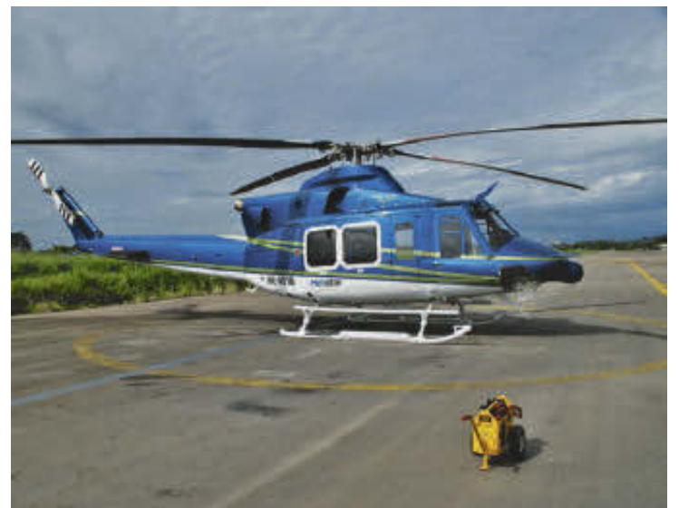
Helistar también celebró un contrato por $2.800 millones con la Oficina del Alto Comisionado para la Paz para transportar a tres jefes guerrilleros hacia Policarpa, Nariño.

Una de ellas fue el 13 de noviembre de 2020, en la cual se extendió el tiempo de ejecución y se amplió el rubro de “gastos reembolsables” —costos que debe asumir Ecopetrol por concepto de combustible, tasas aeroportuarias y manutención de la tripulación—, cuyo valor estimado era de $3.703 millones, y al cual se le fueron haciendo más adiciones, siendo la más reciente la hecha en enero de 2023 por $600 millones.