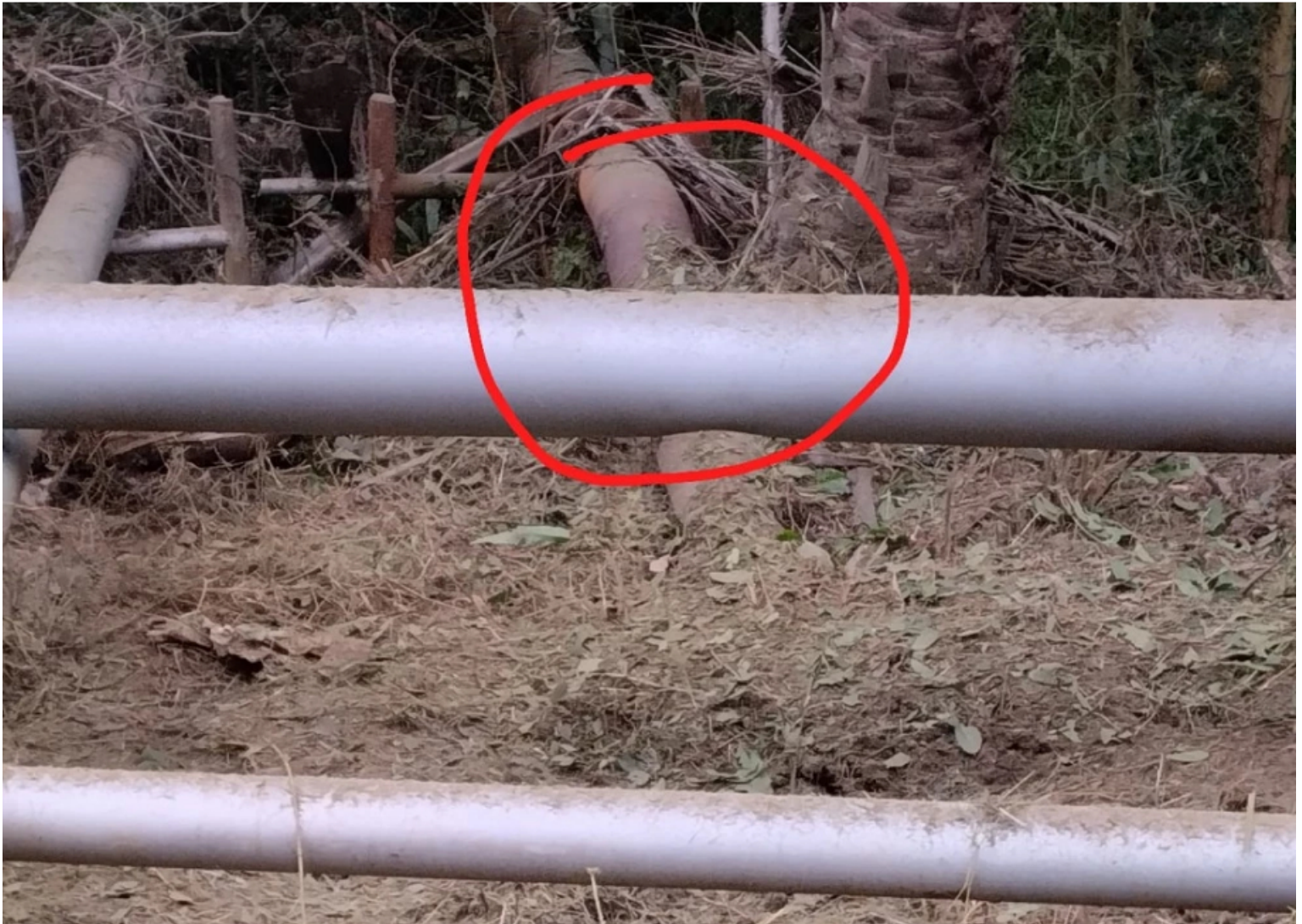
Atentado a oleoducto de Ecopetrol en Barrancabermeja

Policía y Ejército inspeccionan la zona en el corregimiento El Centro donde ocurrió el atentado que habría sido perpetrado por la guerrilla del ELN.