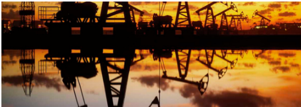
El miércoles de la próxima semana comenzará la discusión sobre las nuevas propuestas de la tributaria.

El ministro de Hacienda, José Antonio Ocampo, aseguró que el próximo lunes, 3 de octubre, se tendrá una nueva reunión para hacer los ajustes finales al texto de la reforma tributaria y así presentar la ponencia. “Yo diría que son unos 10 artículos que tienen cambios”, dijo.