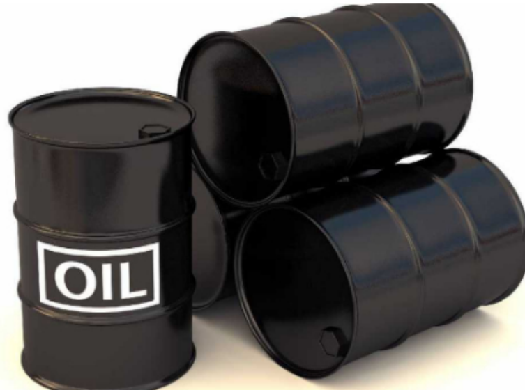
La reforma tributaria propone un impuesto del 10 % sobre las exportaciones de petróleo .

Igualmente, tras las reuniones entre los coordinadores, ponentes y el ministro de Hacienda, José Antonio Ocampo, se decidió reemplazar la prohibición de la deducibilidad de regalías por cinco puntos adicionales en el impuesto de renta , es decir, que pasará del 35 % al 40 % para las empresas del sector mineroenergético.