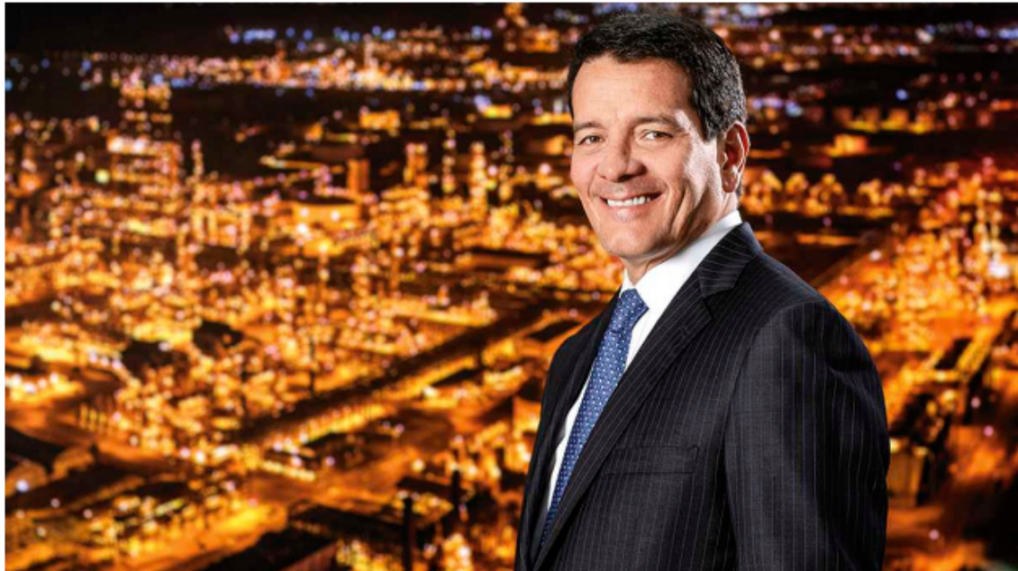
Felipe Bayón, presidente de Ecopetrol.

El presidente de Ecopetrol, Felipe Bayón, aseguró que la reforma tributaria que está tramitando el gobierno del presidente Gustavo Petro tendría un alto impacto en las finanzas de la compañía. “Hemos analizado el impacto de reforma y la reforma podría tener entre cuatro billones y cinco billones de pesos de impacto en Ecopetrol. No es insignificante”, dijo.