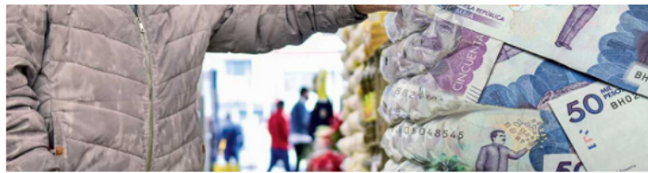
Las decisiones de compra de las familias están condicionadas al entorno económico que perciben en las empresas para las que trabajan.

SEMANA: entonces, hay rebelión entre los ponentes que son quienes van a sustentar el proyecto de ley en los estrados legislativos.