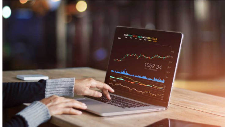
Esta fue una jornada de resultados sorpresivos para la Bolsa de Valores de Colombia.

La Bolsa de Valores de Colombia (BVC) y Ecopetrol sorprendieron a los inversionistas este miércoles 28 de septiembre, luego de que revirtieran la tendencia negativa con la que comenzaron el día y completaran buenos resultados por segundo día consecutivo. Esto, aún a la espera de los anuncios de tasas de interés que se hagan por parte del Banco de la República para el mes de octubre.