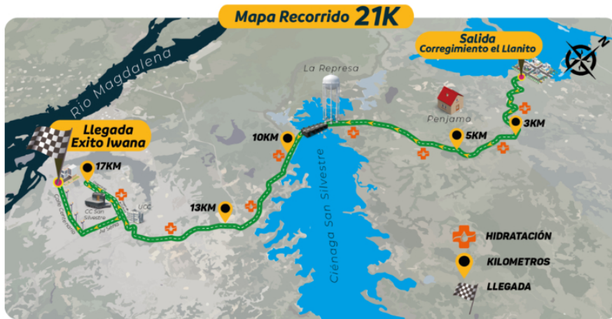
Recorrido de Media Maratón Centenario de Barrancabermeja

Al llegar a 'Barranca' el trayecto pasará por la Universidad Cooperativa de Colombia, el Paseo de la Cultura y el Centro Comercial San Silvestre. Finalmente, tomará la Calle Centenario para recorrer los últimos kilómetros hasta el punto de meta ubicado en el Éxito Iwana.