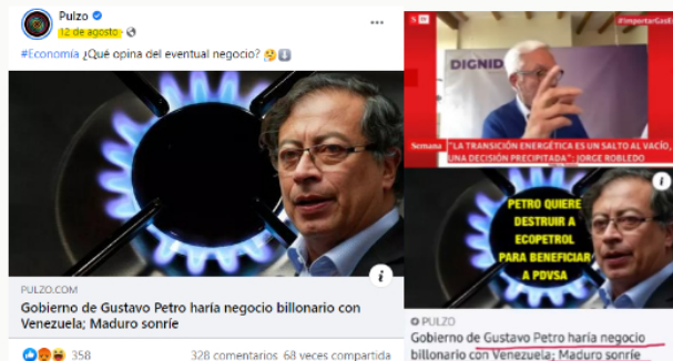
Publicación original del artículo en Facebook/ Captura intervenida en el video

De vuelta al video que circula en redes, mientras en la parte superior se reproduce un extracto de la entrevista con Jorge Enrique Robledo, debajo se fijan dos imágenes. La primera, en pantalla durante el primer minuto, es una captura de pantalla de la publicación en facebook del artículo "Gobierno de Gustavo Petro haría negocio billonario con Venezuela; Maduro sonríe" donde el portal Pulzo replica las declaraciones de la Ministra en Blu. La captura está alterada, pues la publicación original no tiene el texto "Petro quiere destruir a Ecopetrol para beneficiar a PDVSA" .