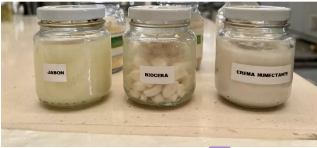
BLU Radio. Cremas de aceite de palma

Ecopetro , la Universidad Industrial de Santander y el Sena, apoyaron el emprendimiento de los palmicultores . Por eso aprendieron a convertir el aceite de palma en biocera para los cosméticos.