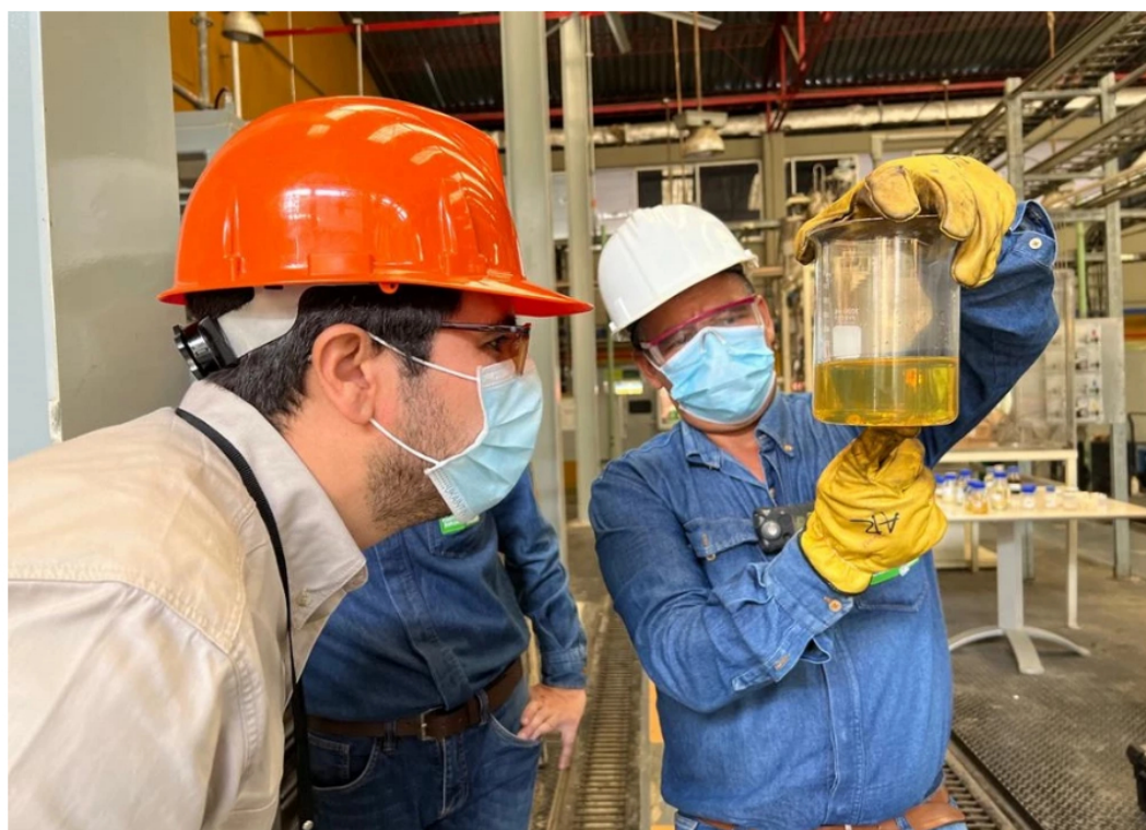
BLU Radio. Fabricación cosméticos con aceite de palma

El Instituto Colombiano del Petróleo capacitó a los palmicultores para que produzcan hasta bloqueadores solares.