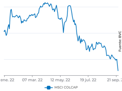
MOVIMIENTO DEL MSCI COLCAP

TEMAS DE CONVERSACIÓN > REAPERTURA FRONTERA VENEZUELA OPA POR NUTRESA CRISIS EN UCRAINA CRECIMIENTO ECONÓMICO REFORMA TRIBUTARIA 2022