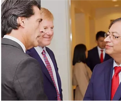
Gustavo Petro sobre las protestas: "Están en su derecho, pero ellos ocasionaron el problema"