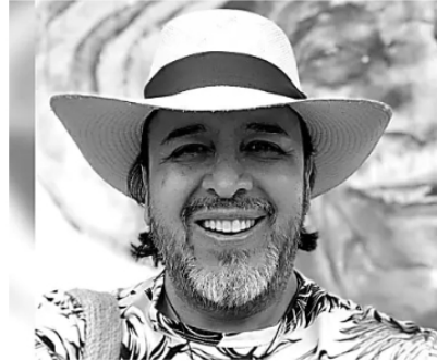
Fallece el actor Toto Vega tras finalizar el Festival de Cine Verde de Barichara