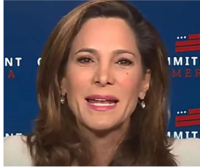
Congresista republicana dice que Gustavo Petro está delirando por discurso ante la ONU