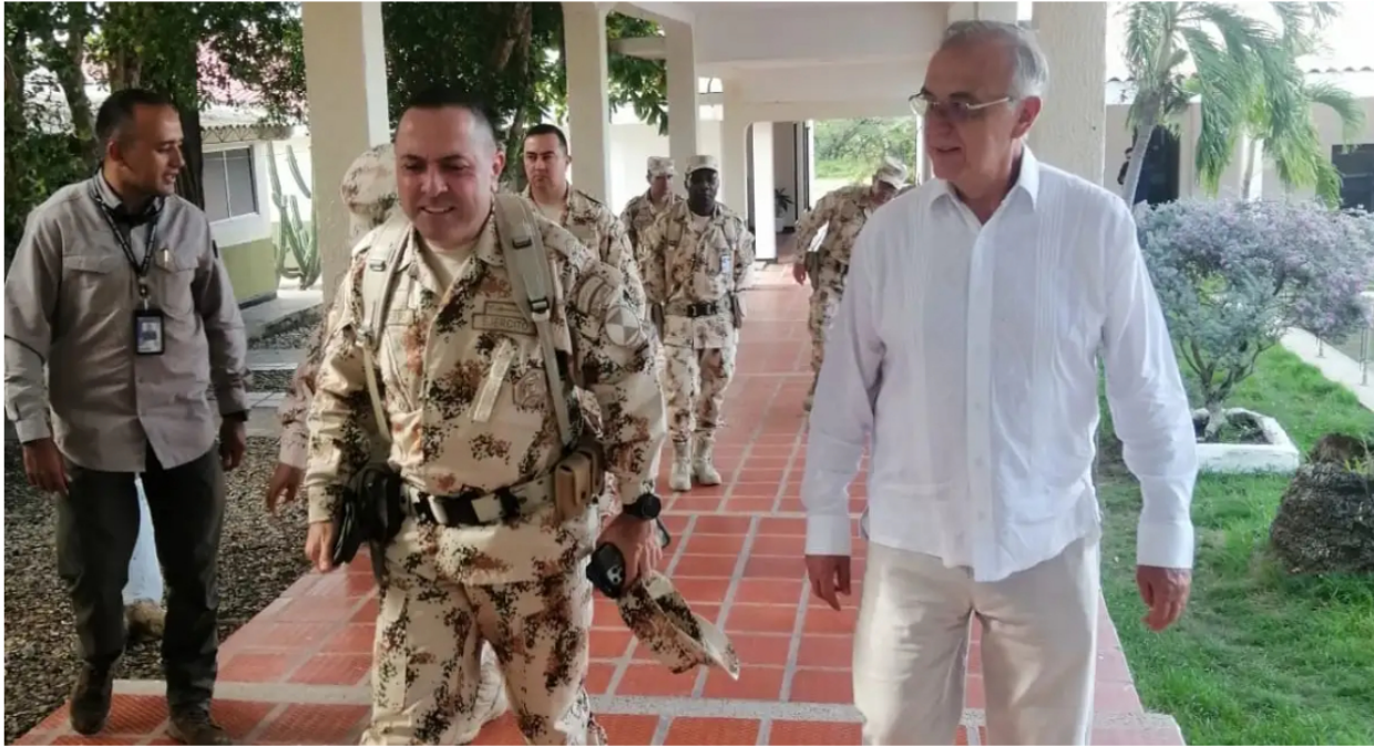
La advertencia del Mindefensa a las manifestaciones sociales.

Una contundente advertencia lanzó el ministro de Defensa, Iván Velásquez, a las personas que saldrán a las calles este 26 de septiembre para manifestarse en contra de algunos proyectos del Gobierno como la reforma tributaria, pensional, electoral y el alza del precio de la gasolina.