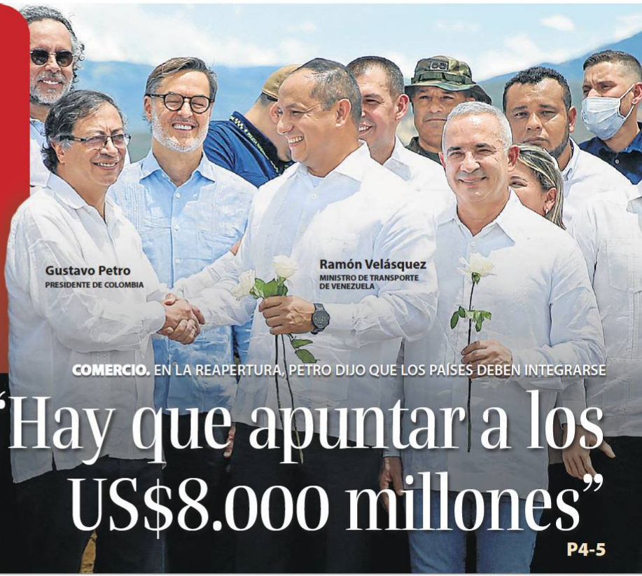
Gustavo Petro PRESIDENTE DE COLOMBIA