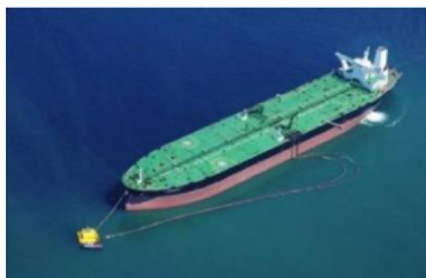
Los despachos de Ecopetrol a Citgo representaron 30% de las exportaciones petroleras de Colombia hacia Estados Unidos

La empresa colombiana Ecopetrol y la compañía de refinación Citgo, filial de Petróleos de Venezuela (PDVSA) en Estados Unidos, han vuelto a intensificar su relación comercial, la cual impulsaron en 2019 luego que el gobierno de los Estados Unidos impusiera sanciones que dejaron al crudo venezolano sin poder venderse en el mercado norteamericano. Los suministros de crudo Castilla enviados por Ecopetrol a Citgo durante el primer semestre de 2022 alcanzaron un volumen promedio de 48.100 barriles diarios, un volumen que más que triplica lo enviado durante el mismo período de 2021. En términos relativos indica un alza de 246%. Si bien en febrero, los despachos tuvieron un mínimo de 17.800 barriles por día, en junio repuntaron a 70.800 barriles, monto que representa 30% del total de petróleo y combustibles que Colombia colocó en territorio estadounidense durante el sexto mes del año.