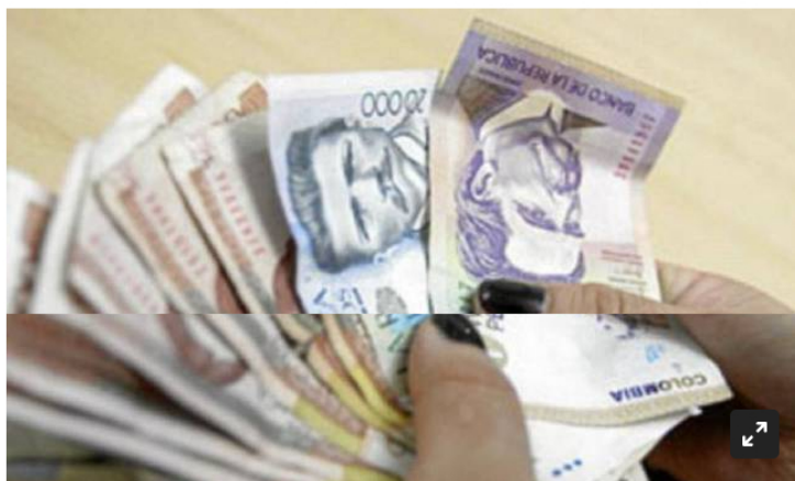
Dinero colombiano

El proyecto, que fue aprobado en primer debate, abre la puerta a modificaciones en la focalización del subsidio de luz y gas, pues harán un cruce entre la estratificación y la información socioeconómica de los usuarios.