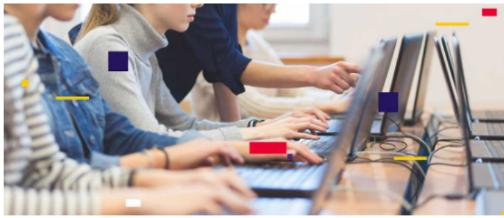
Cumbre Udees por la Educación 2022 - La educación transforma

El otro monto abultado que sobresale entre los sectores con más asignación es Hacienda con 43,8 billones de pesos, pero, según el senador Gustavo Bolívar, si se incluye la cifra destinada a subsidios del precio de la gasolina, la cifra asciende a 49,3 billones de pesos.