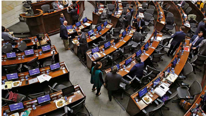
En las comisiones económicas de Senado y Cámara se tendrá que aprobarse la iniciativa antes del 23 de septiembre.

En un documento de 188 páginas, el gobierno de Gustavo Petro rehizo y condensó el contenido de la carta presupuestal para 2023, que había sido presentado por el gobierno saliente, por 391,4 billones de pesos y pasó a tener ahora 405,6 billones de pesos.