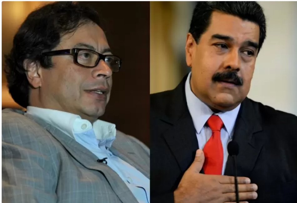
De izquierda a Derecha: Gustavo Petro y Nicolás Maduro