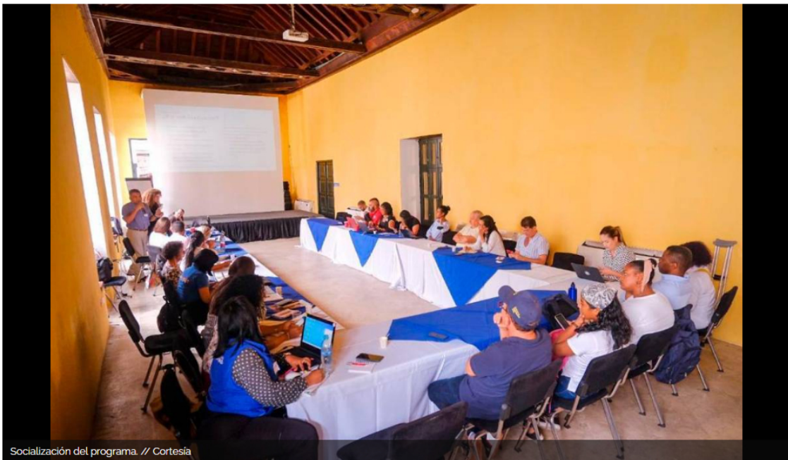
Socialización del programa.

La Alcaldía, a través del PES - Pedro Romero, apoyará el modelo de capacitación en barrios de la ciudad de Opportunity International y AGAPE Colombia.