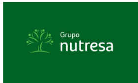
Grupo árabe lanza jugosa oferta por Nutresa