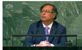
El fuerte mensaje del presidente Petro ante la Asamblea General de la ONU