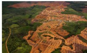
Petro cuestiona en la ONU al capitalismo como causante del desastre climático