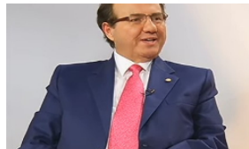
Corte Suprema ordena la captura del exmagistrado José Leonidas Bustos