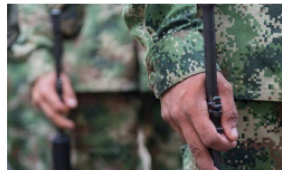
Servicio militar obligatorio se eliminará gradualmente