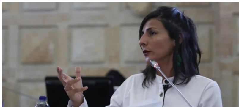
Irene Vélez Torres, ministra de Minas y Energía.

Una de las funcionarias más criticadas del gobierno de Gustavo Petro ha sido la ministra de Minas, Irene Vélez; casi desde el día uno de su liderazgo, la funcionaria ha sido cuestionada por diferentes asuntos en sus intervenciones en el que para muchos de los sectores de oposición demuestra desconocimiento y, por tanto, han exigido su renuncia. Esto no ha sido un problema, pues, el presidente de la República la ha salido a respaldar.