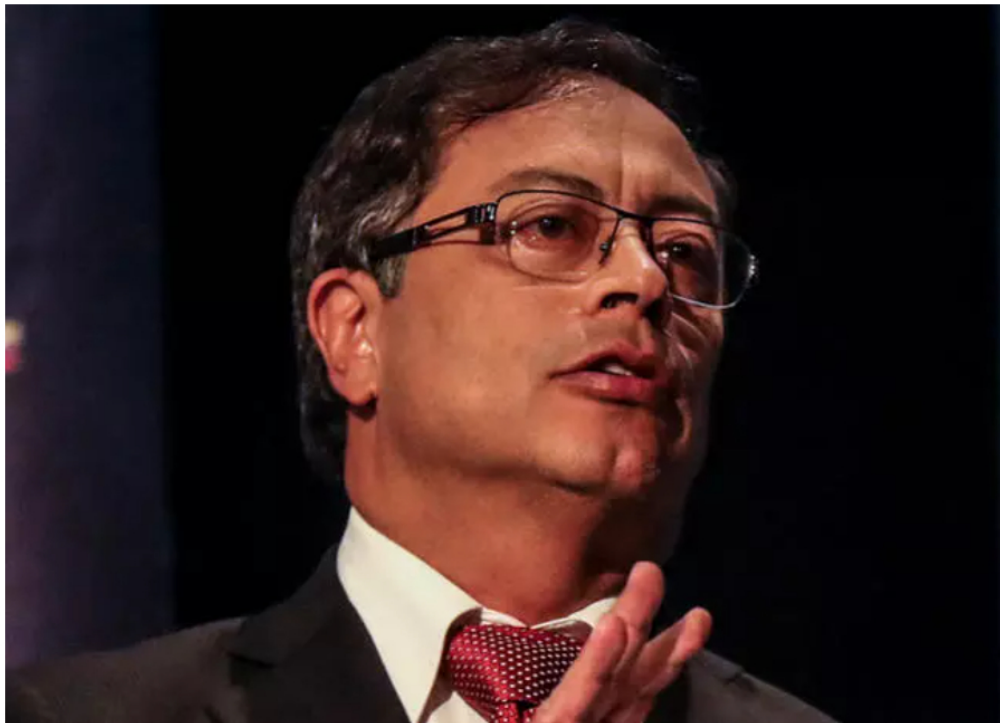
Gustavo Petro

El mandatario justificó el reciente aumento al precio de la gasolina.