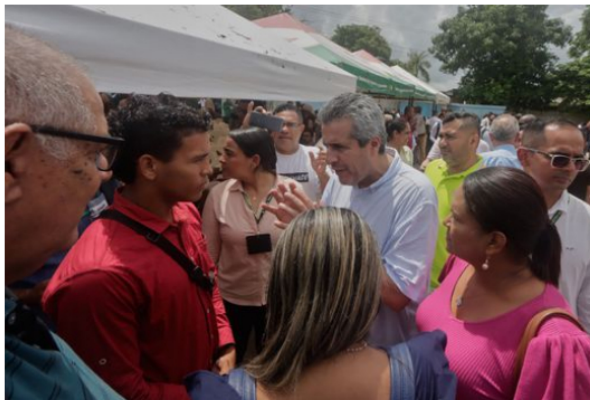
Los ciudadanos están llamados a tomar la palabra y asumir el liderazgo, además de visibilizar problemas y realidades ignorados en sus regiones y comunidades.